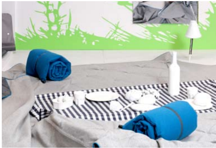
Anita Schwank should i Stay? Diplomausstellung Zürich, 2008