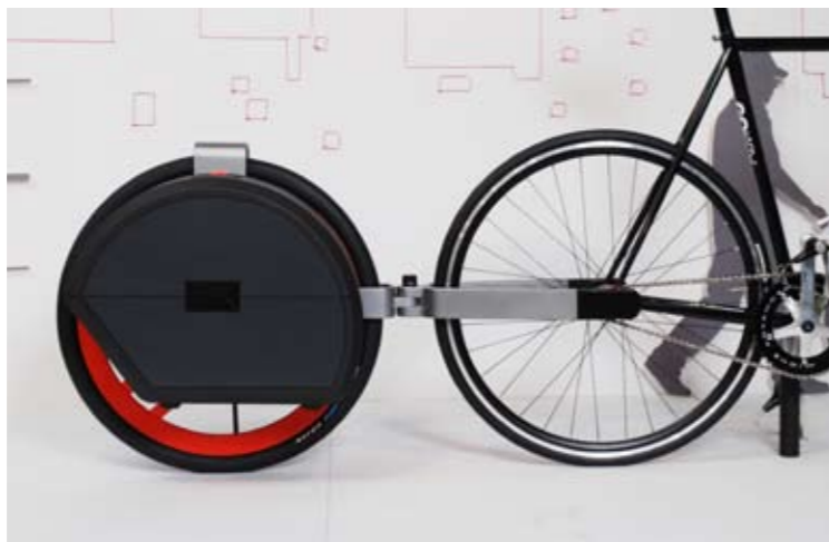
Manuel Gamper Packman Diplomausstellung Zürich, 2008