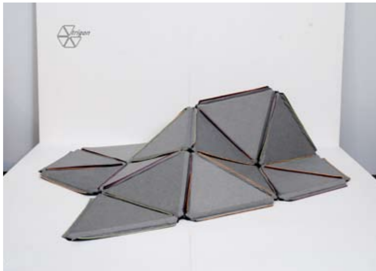
Rahel Endress trigon – Von der Fläche in den Raum Diplomausstellung Zürich, 2008