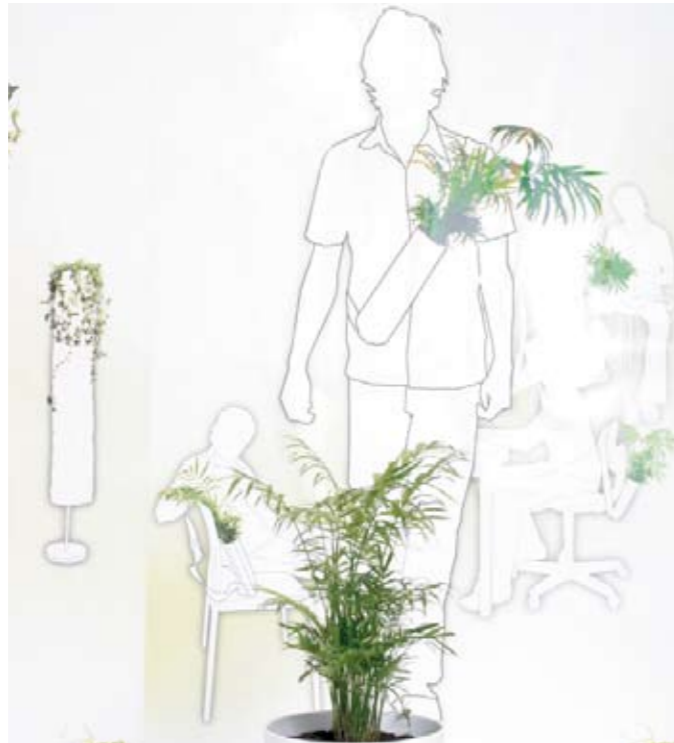
Fabrice Debenath Eden Diplomausstellung Zürich, 2008