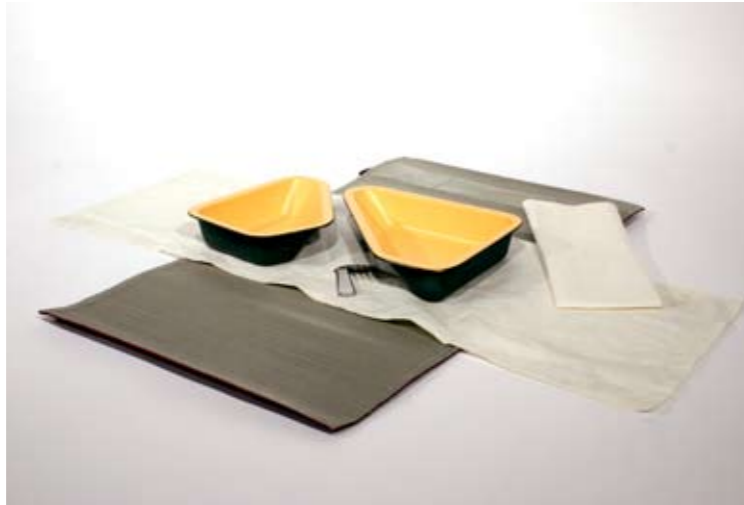
Timon Ambühl Casita Diplomausstellung Zürich, 2008