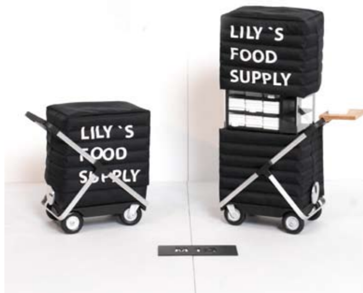
Daniel Vetterli Food Supply Diplomausstellung Zürich, 2008