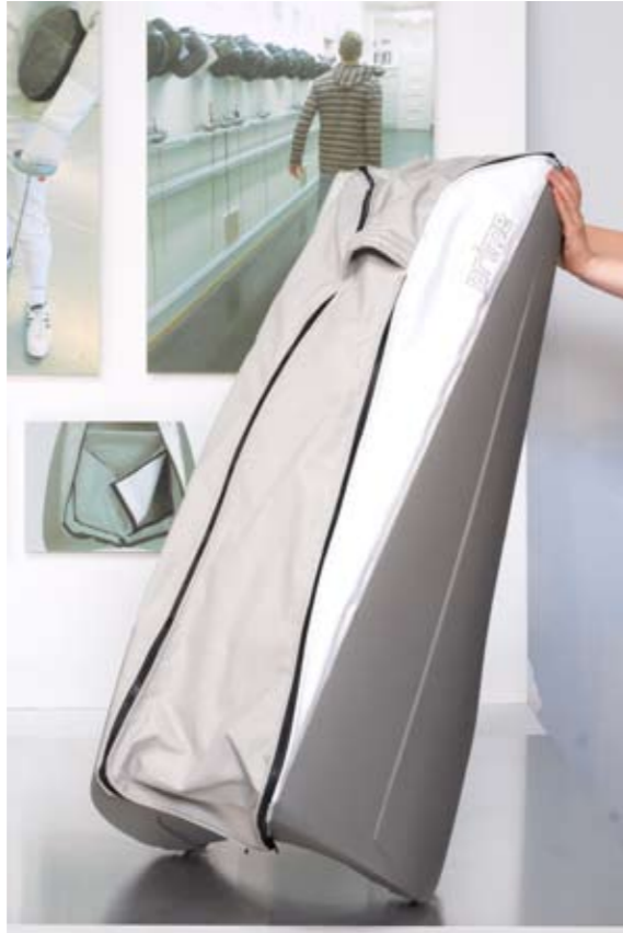
Tabea Steffen prime Diplomausstellung Zürich, 2008