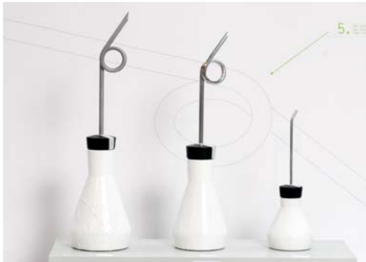
Linus Jeuch vergo Diplomausstellung Zürich, 2008